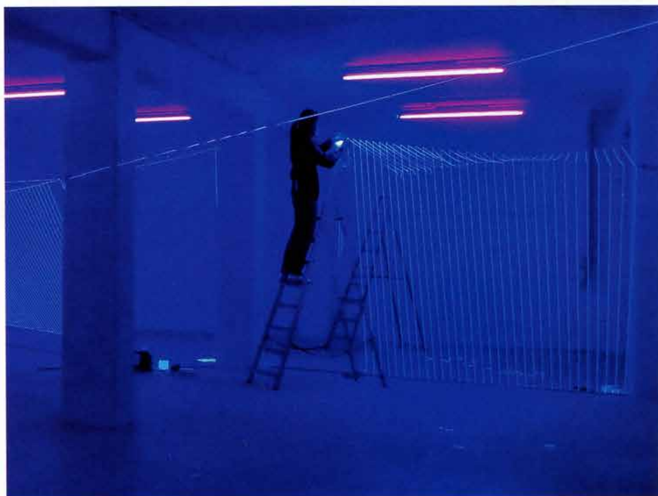
Von links oben im Uhrzeigersinn: Entwürfe für ‚Puls‘. In Jeongmoon Chois Atelier gehen dem Aufbau des Werks Tests voraus. Die Künstlerin installiert die langen Fäden meist allein, höchste Konzentration ist erforderlich für die meditative, gleichförmige Arbeit

die 3-D-Zeichnung. Diese Vielansichtigkeit ist mir besonders wichtig.