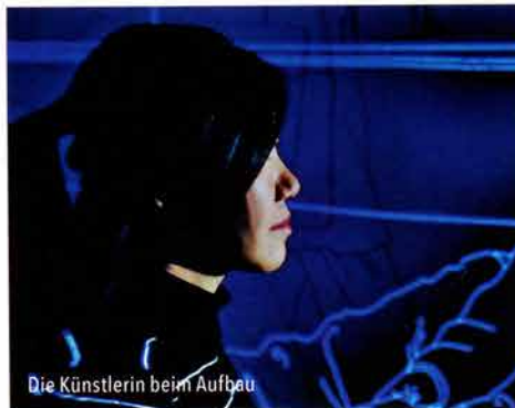
Die Künstlerin beim Aufbau

ten. Zuerst waren es Bleistiftzeichnungen, inspiriert von seismografischen Kurven. Dann